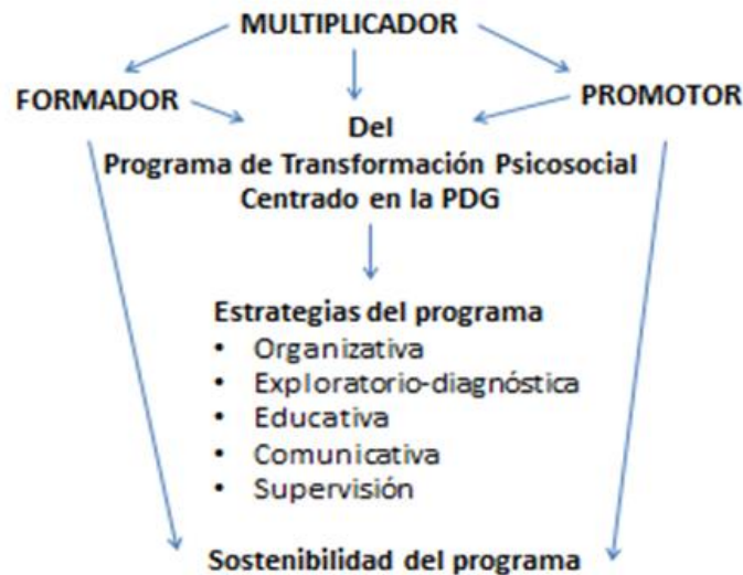
Gráfico 1. Multiplicador del PTPSCPDG

parte, se preparan para asumir el rol de Formadores del PTPSCPDG, responsables de la formación de nuevos multiplicadores, que a su vez participarán en el proyecto comunitario actual o asumirán sus propios proyectos. Por otra parte, se forman como Promotores del PTPSCPDG, lo que constituye un complejo rol pues integra las funciones de promotor deportivo, cultural, de salud, etcétera. Este promotor “integral” organiza sus acciones atendiendo a las diversas necesidades de transformación psicosocial que manifiestan las comunidades a lo largo del proceso utilizando como herramienta principal la PDG y las estrategias del PTPSCPDG.